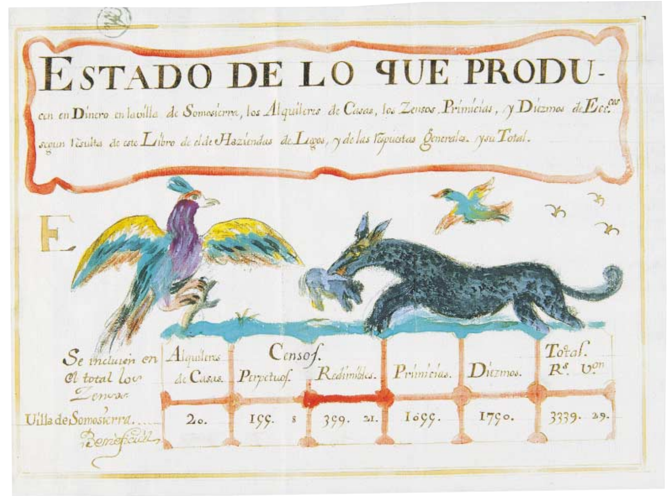
Estados D de Mengibar, uno de legos y otro de eclesiásticos. Estados E de Somosierra y Berzosa. (AHN).

Cuando se acababan los libros de lo raíz (uno de legos y otro de eclesiásticos) y los de los cabezas de casa (también dobles), se procedía al acto más solemne de la averiguación de cada pueblo: la lectura en concejo abierto . Para ello se convocaba de nuevo a vecinos y forasteros con bienes en el pueblo mediante pregón o bando, para que asistieran a la lectura, partida a partida, de los libros de lo raíz, por si alguien se sentía agraviado o consideraba que algún dato propio o ajeno era falso o incorrecto. Si todos los asistentes daban su conformidad, se procedía a firmar la diligencia de lectura por parte del subdelegado, las autoridades, los peritos y el escribano, siendo tal acto garantía para el rey y los vasallos. Y si había alguien discrepante, se procedía a apurar la verdad , corrigiendo lo que procediere. Con ello se despedía la audiencia, que pasaba al siguiente pueblo, donde ya días antes habían promulgado el bando y anunciado su llegada. Y así pueblo tras pueblo. Muchos equipos catastrales estuvieron cuatro años errantes, lejos de sus familias, catastrando las Castillas. ■