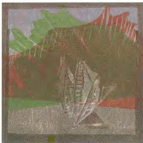
Las ilustraciones de esta monografía son obra de Justo Barboza